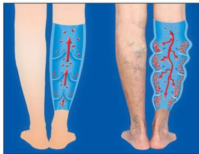
Vlevo správný tok krve v noze, vpravo noha s křečovými žilami.

Nejúspěšnějším způsobem odstranění metlic je sklerotizace, což jsou injekce velice slabou jehlou s podáním speciální