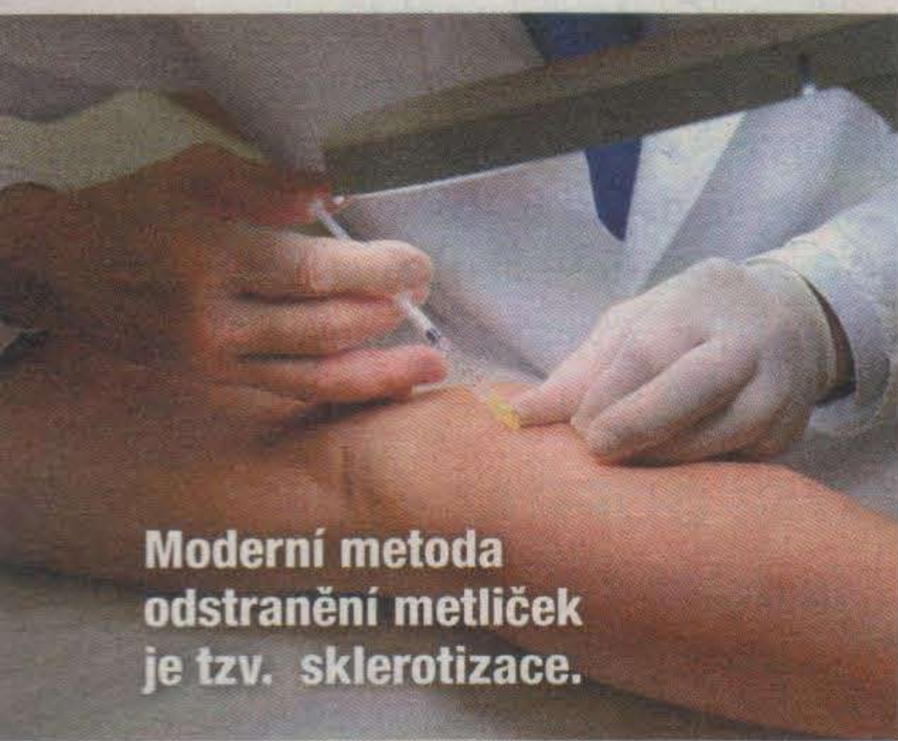
Moderní metoda odstranění metliček je tzv. sklerotizace.

Přípravila: Hana Primusová